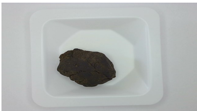
Bild der eingelangten Probe vom 24.08.2022