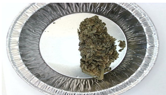
Bild der eingelangten Probe vom 18.07.2022