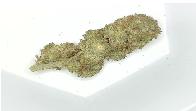
Bild der eingelangten Probe vom 13.10.2022