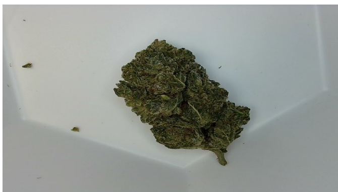
Bild der eingelangten Probe vom 18.11.2022