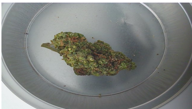
Bild der eingelangten Probe vom 07.04.2022