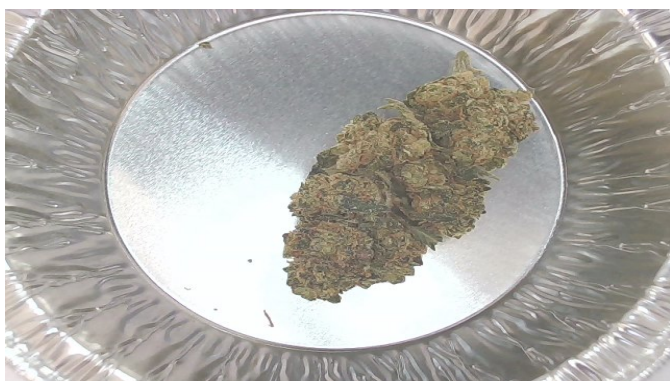
Bild der eingelangten Probe vom 17.08.2022