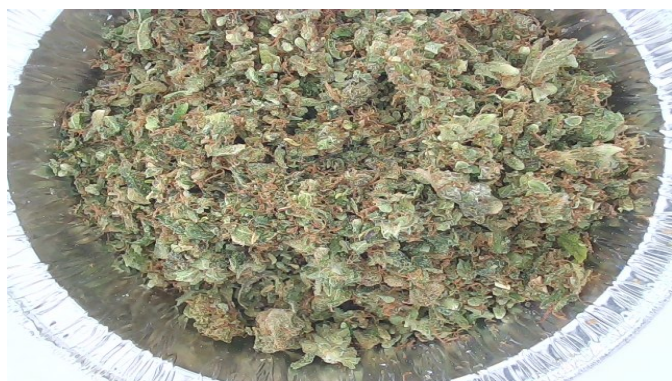
Bild der eingelangten Probe vom 28.07.2022