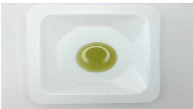
Bild der eingelangten Probe vom 21.07.2022