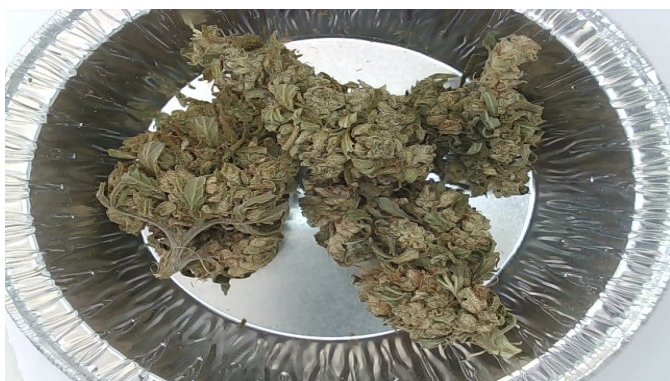
Bild der eingelangten Probe vom 30.06.2022