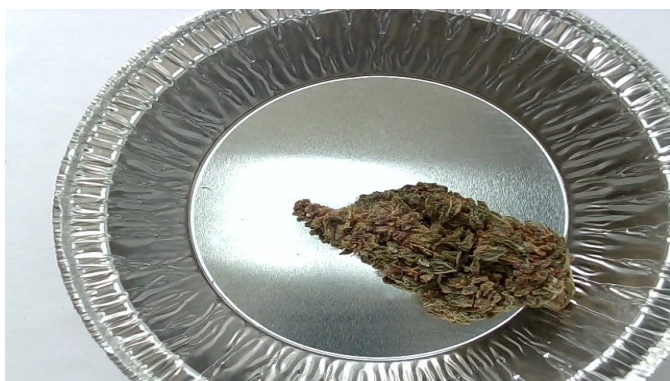
Bild der eingelangten Probe vom 13.05.2022

Komentarz: Unerwartete Decarboxylierung während der Probenvorbereitung. Gesamt-CBD ist davon unberührt.