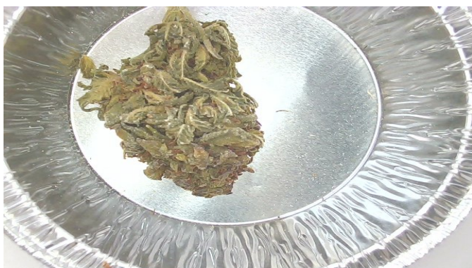
Bild der eingelangten Probe vom 30.05.2022