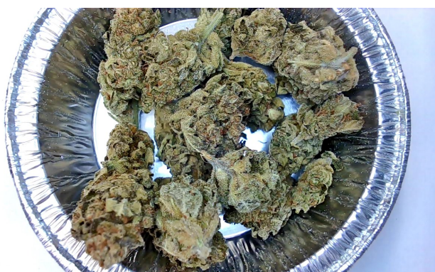
Bild der eingelangten Probe vom 21.01.2022